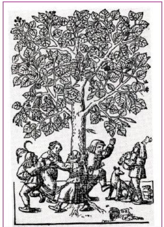
Danse autour d'un tilleul. Hieronymus Bock, Kreutterbuch, 177. From Witchcraft Medicine