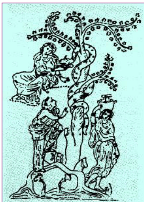
Image typique de l'Arbre dans le Jardin des Hespérides avec son serpent gardien

En fait, Wolfram nous dit que Malcréature et Kundrie furent tous deux envoyés à la famille du Graal par le Reine Secondille, la femme Arabe de Fierfiz, le demi-frère de Perceval avec lequel il est réuni dans le chapitre 16. (Je pense, personnellement, qu'il en fait un peu trop au niveau de l'entrelacement, à ce point). En élaborant cette partie de l'histoire, Wolfram transmet un message enthéogénique fondamental concernant les peuples originels ou indigènes: "Notre père Adam, qui nomma toutes choses selon leur nature, connaissait les mouvements des étoiles et des sept sphères et connaissait aussi les vertus des plantes" (JC, page 472). Et voilà, tout est dit en une seule phrase, tout ce que les théocrates ne veulent pas que nous sachions quant à nos origines et à nos ressources innées!