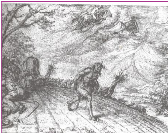
Le Diable qui sème des champignons. Jacob de Gehyn II, 1565-1629.

Le véhicule du pouvoir satanique est le Mensonge, Drugh en ancien Persan. Dans une large mesure, la propagation du mensonge consiste en une campagne contre les "drogues" qui perdure depuis que Yahvé a interdit à Adam et à Eve de consommer du fruit de l'Arbre Sacré. Dans une large mesure, le Mensonge fonctionne parce que les "drogues" interdites ne sont pas des drogues tandis que les drogues qui sont réellement des drogues ne sont pas interdites mais colportées sur une vaste échelle par les autorités en place. C'est une tactique fondamentale de contrôle mental: interdire l'accès aux pouvoirs sacrés de la nature et encourager toutes sortes de toxicomanies non naturelles. Tout le monde est au courant des drogues que le patriarcat fournit au monde entier, à la fois légalement et illégalement, mais quasiment rien n'est connu des élixirs naturels qui véhiculent la connaissance de la survie humaine et assurent l'indépendance vis à vis du système dominant.