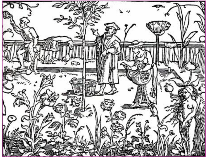
«The Garden of Health,» Antwerp, 1533. In Witchcraft Medicine , Claudia Muller-Ebeling et al. La présence d'une "plante-humaine" dans le bas à droite est la preuve d'une communication avec les plantes chez les natifs: les plantes nous parlent comme si elles étaient des êtres humains comme nous.

Lorsque Cidegast fut tué, Orgeluse ne perdit pas seulement son premier amour. Elle perdit la connexion avec tout ce qu'il représentait. Je soutiendrais que la licorne est une version du Mesotes, l'animal totémique mystique de la quête de vision Européenne. La corne unique, blanche et spiralée est une image du "puits" doux de Lumière Organique qui pénètre l'adepte en transe et en contemplation au travers du troisième oeil - l'escarboucle de l'os frontal de la licorne. Wolfram entrelace la connaissance alchimique et la connaissance des plantes médicinales dans les deux narrations avec beaucoup de finesse.